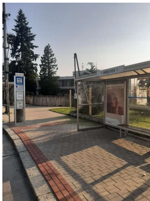
Konečná zastávka Hřbitov směr Z LIBNÍČE, přestup na MHD č. 2