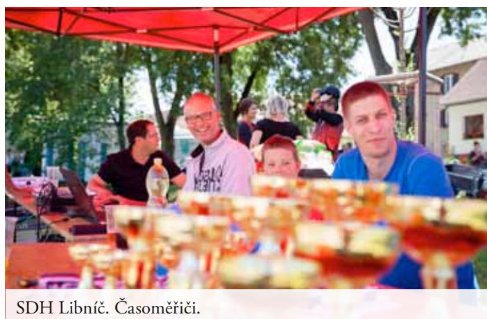
SDH Libnič. Časoměřiči.