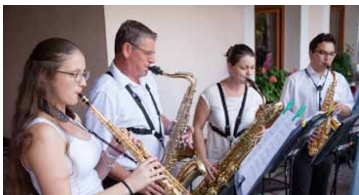
Lázeňská kapela na nádvoří lázní - South Bohemia Sax Quartet(SBSQ).