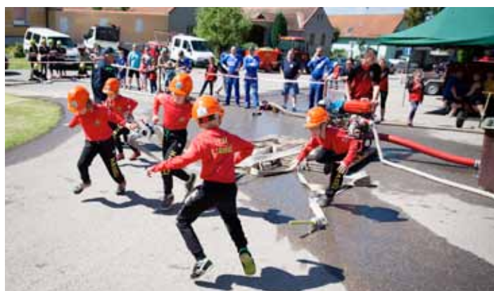
SDH Libnič. Soptíci - Připravit, pozor, start!