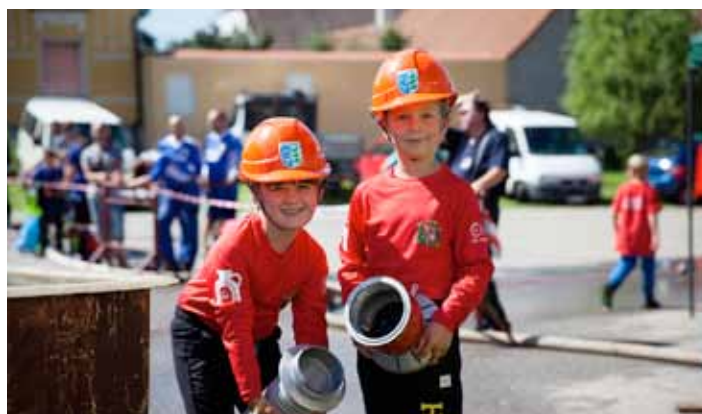
SDH Libnič. Soptíci - jako do kalendáře.