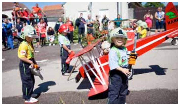
SDH Hamr Soptíci - vyproštění z lesního porostu.