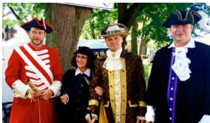
Amatéřské divadlo Libnič - herci.