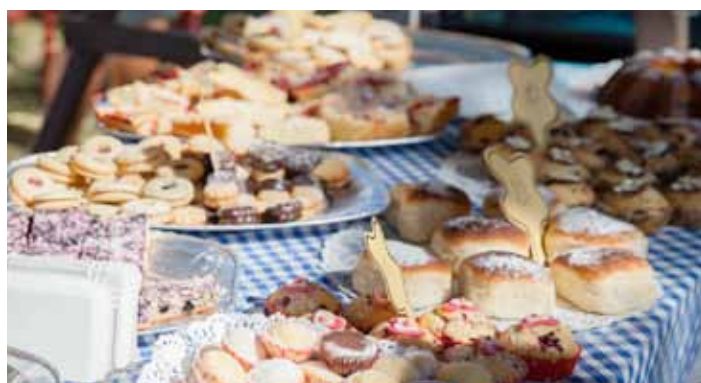
Lázeňská cukrárna - společné pečení pro pohodu Libničských slavností.