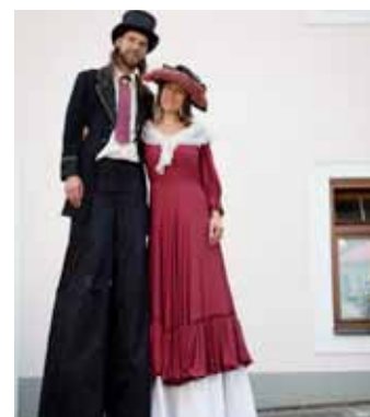
Lázně Libnič - Cirkus Paciento.