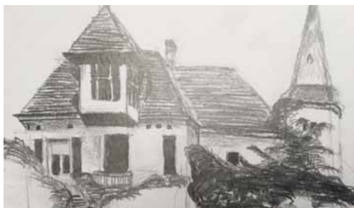
Lázně Libnič - vernisáž AJG (Alšova jihočeská galerie).