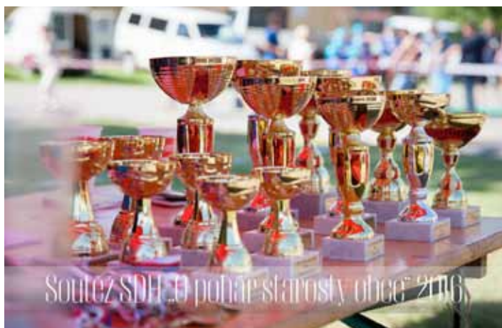
Soutěž SDH... pohár starosty obce 2016