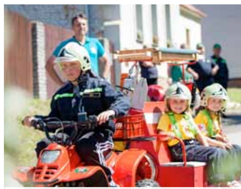
SDH Hamr Soptíci - ukázkový zásah u havárie letadla v Libniči.