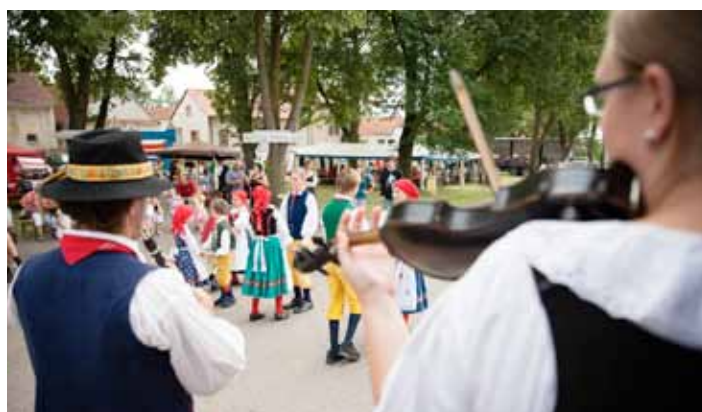
Libničské slavnosti - Malý Furiant na libničské návsi.