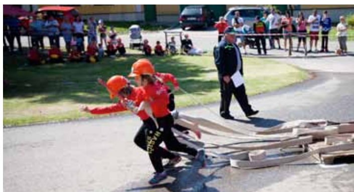
SDH Libnič. Soptíci - jedu, jedu, ať dorostenci vidí, jak se to má dělat!