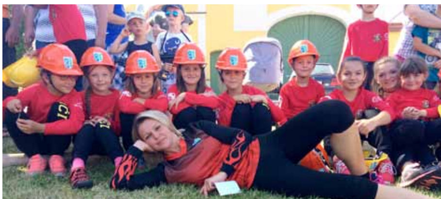
Soutěž SDH Libnič. Soptíci 2016.