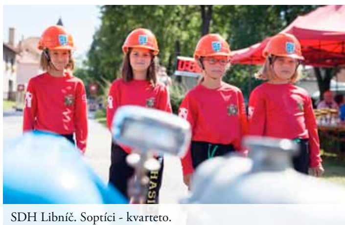
SDH Libnič. Soptíci - kvarteto.