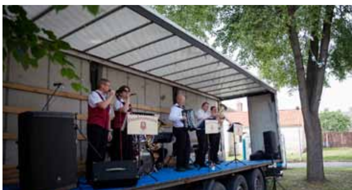
Libničské slavnosti - odpolednem provázela malá dechová hudba Doubravanka.