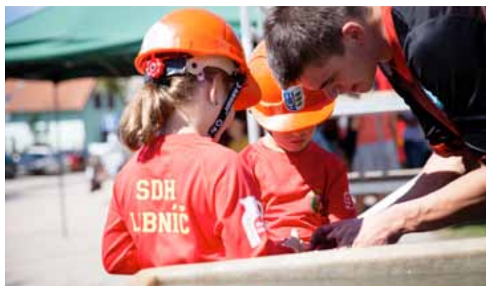
Soutěž SDH Libnič. Soptíci - poslední rady mazáků.