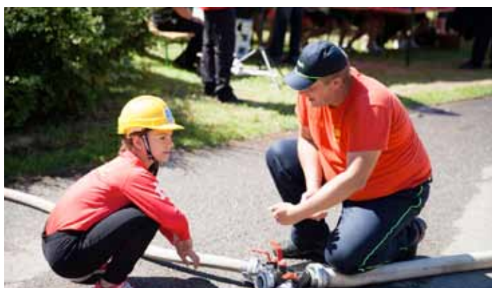
SDH Libnič. Soptíci - poslední rady mazáků.