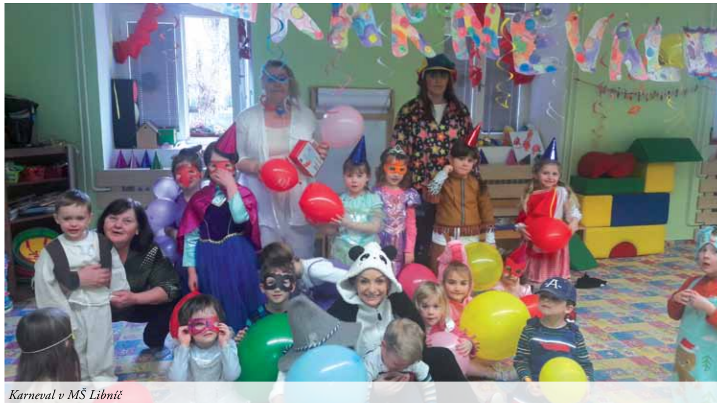
Karneval v MŠ Libnič

Zveme všechny rodiče a občany Libniče i okolí na prohlídku mateřské školy.