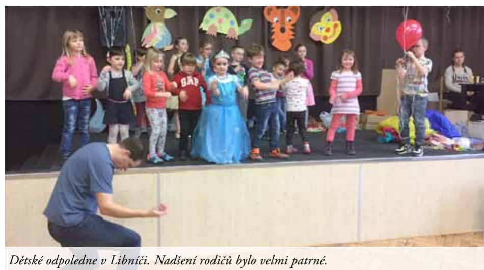
Dětské odpoledne v Libniči. Nadšení rodičů bylo velmi patrné.