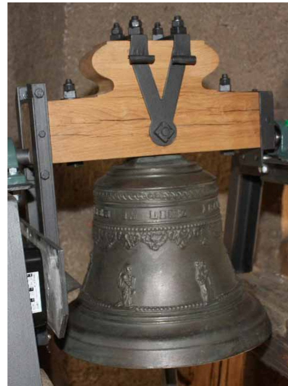
Obr. 1 Zvon sv. Barbora