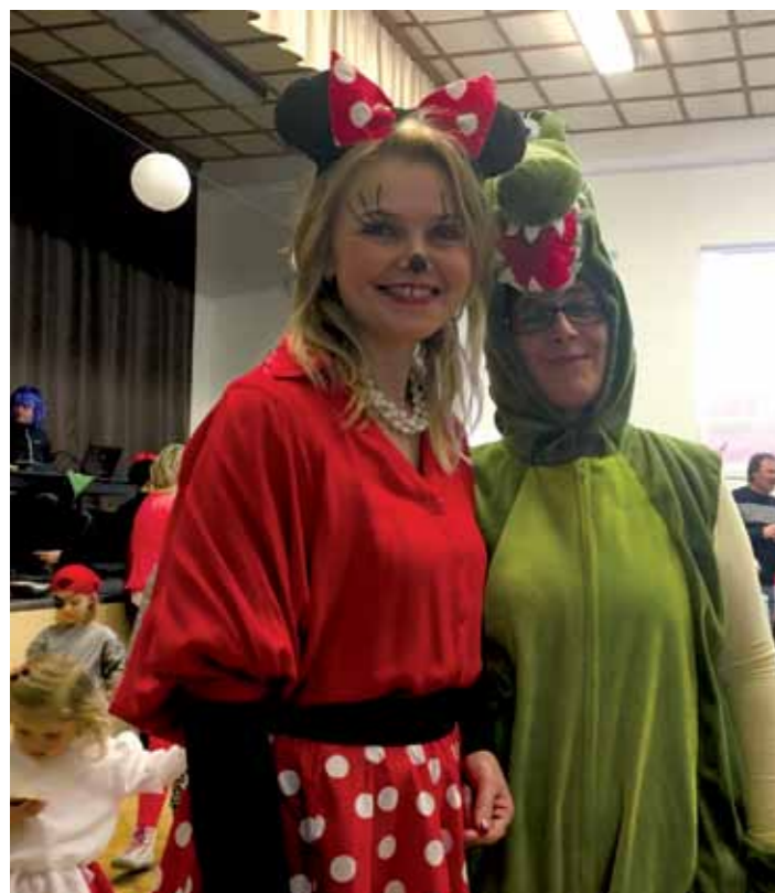
Obr. 1 Dětský karneval