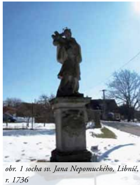
obr. 1 socha sv. Jana Nepomuckého, Libnič, r. 1736

V průběhu 10. Libničských slavností jsme při komentovaných prohlídkách obce věnovali soše sv. Jana Nepomuckého celé jedno zastavení. Z Vašich kladných ohlasů vyplynulo, že se Vám povídání o této naší soše, zřejmě díky lidskému rozměru, líbilo. Z tohoto důvodu jsme se rozhodli vrátit se k příběhu ještě jednou a dát mu písemnou podobu tady v Rozhledech.