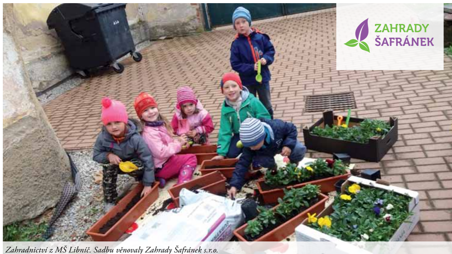
Zahradnictví z MŠ Libnič. Sadbu věnovaly Zahrady Šafránek s.r.o.