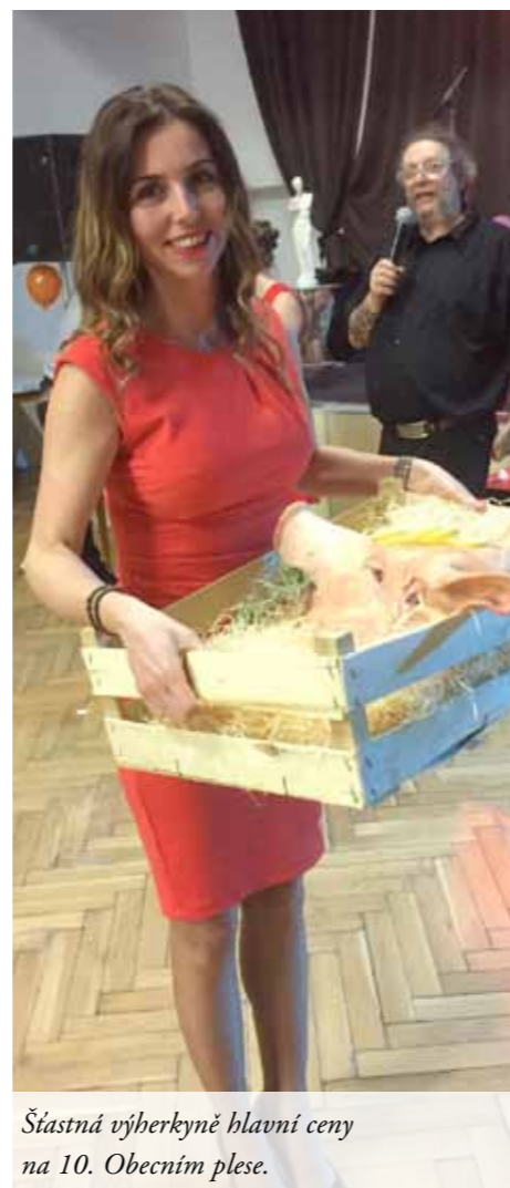
Šťastná výherkyně hlavní ceny na 10. Obecním plese.