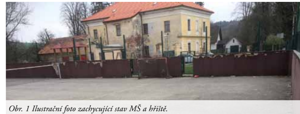
Obr. 1 Ilustrační foto zachycující stav MŠ a hřiště.