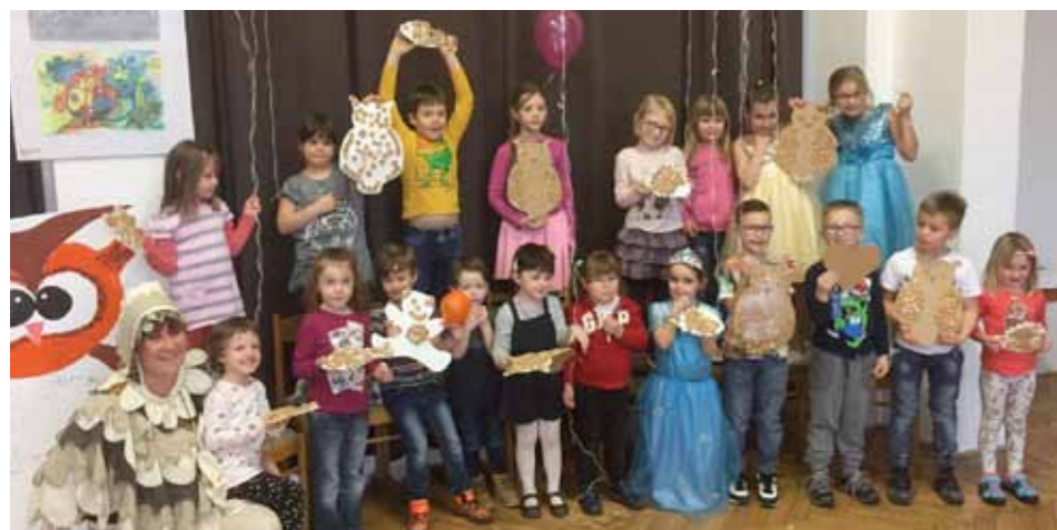
Dětské odpoledne v Libniči.