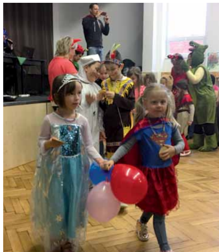
Obr. 1 Dětský karneval