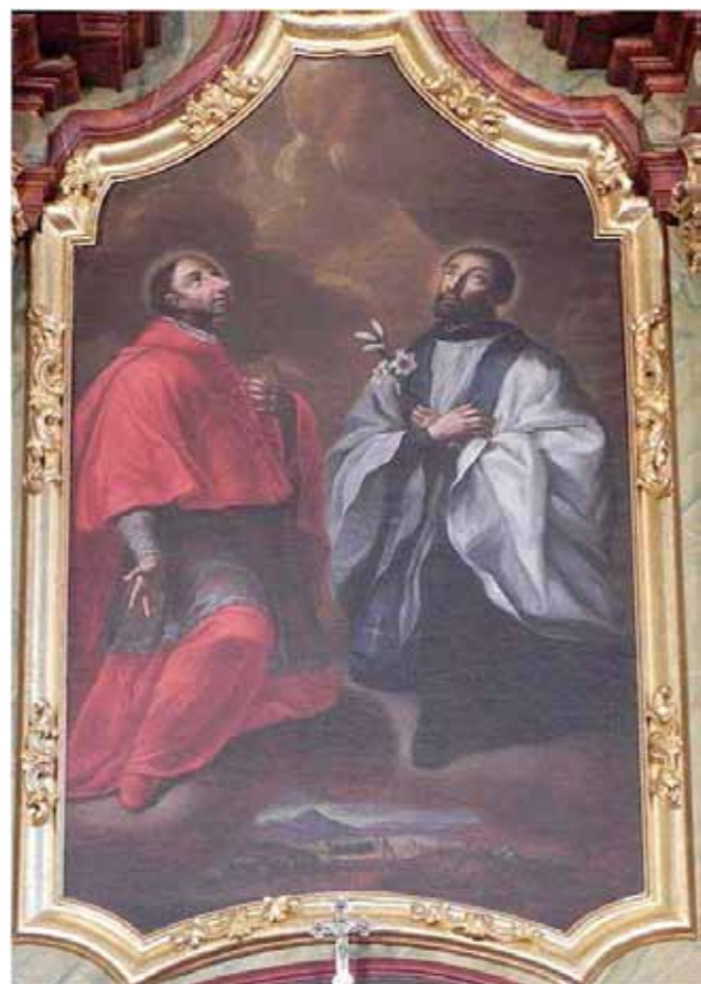
Detail oltářního obrazu – sv. Karel Boromejský a sv. František Xaverský se obracím k Nejsvětější Trojici s přímluvou za lidstvo trpícím morem