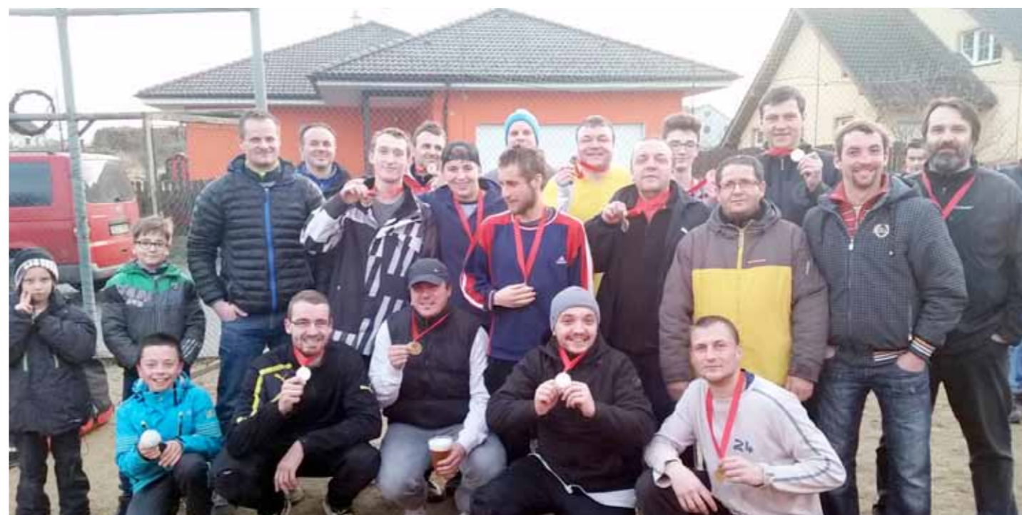
Vánoční hokejbalový turnaj v roce 2015