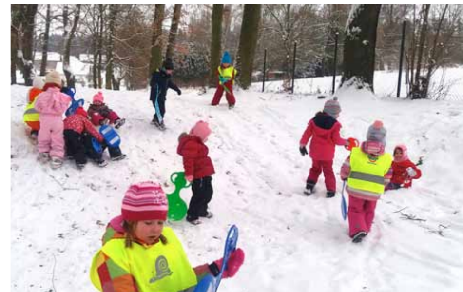
Zimní radovánky dětí z MŠ Libnič.

Bylo připraveno 60 atraktivních balíčků po 105Kč/ks, ve kterých sice chyběly mandarinky a jablka, ale naopak jsme vsadili na dětskou tvořivost a představivost a vložili do nich plastickou modelínu, hrací kostku a sladkosti. Rádi bychom poděkovali všem, kteří se zúčastnili příprav na kulturní odpoledne. Spe-