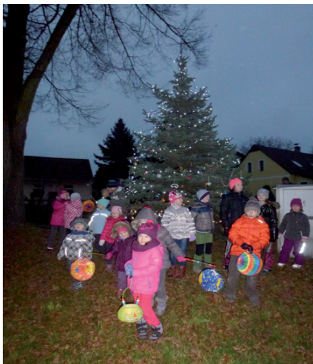
30. listopadu 2014 - lampiónový průvod