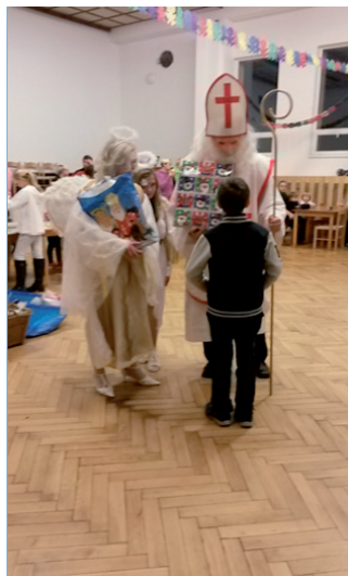
7. prosince 2014 Mikuláš