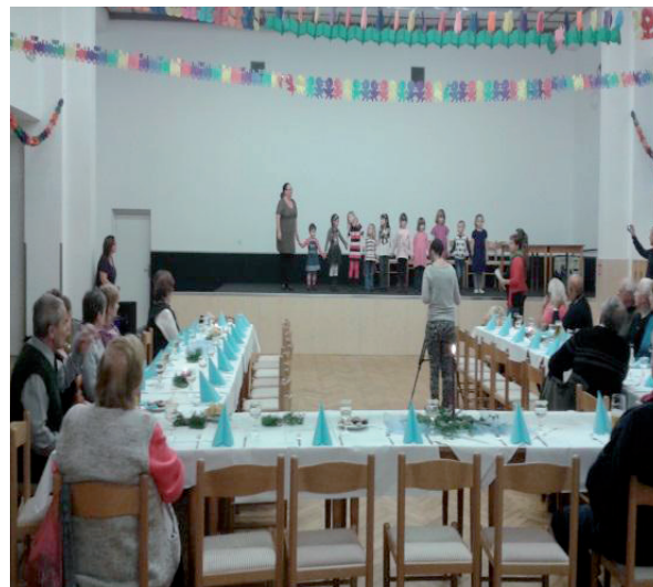
7. prosince 2014 Setkání seniorů se zdobením vánočního stroměčku