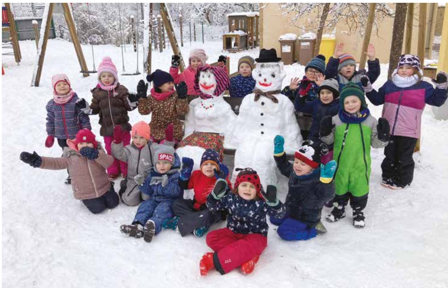
Vítězný sněhuláci ve facebookové soutěži o nejhezčího sněhuláka.