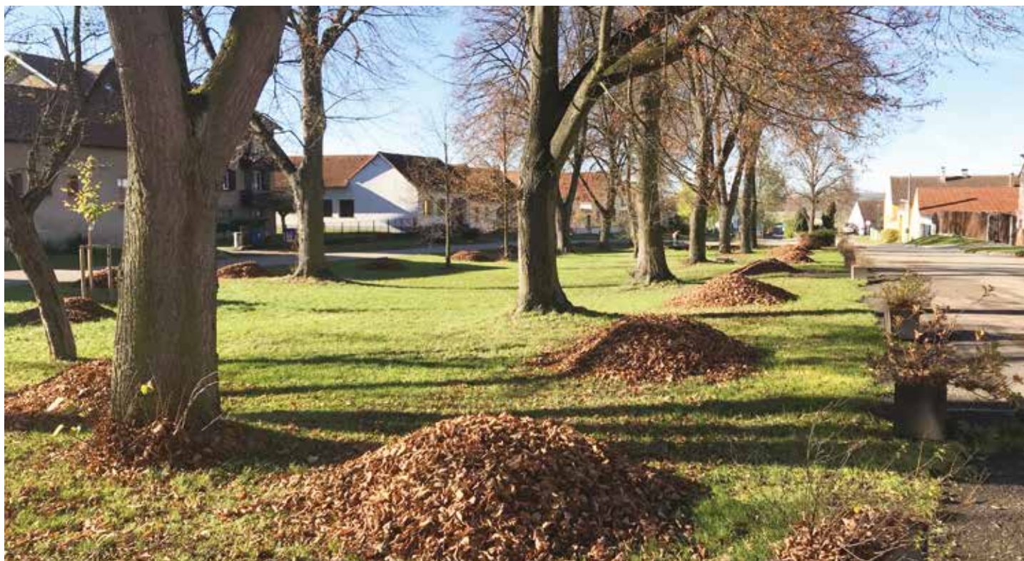
Poděkování za příkladnou údržbu zeleně obce a úklid sněhu. OÚ Libnič