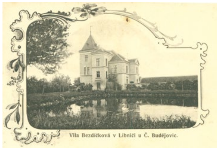
Vila Bezdícková v Libníči u Č. Budějovic.