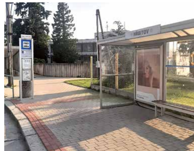
Konečná zastávka Hřbitov směr Z LIBNÍČE, přestup na MHD č. 2