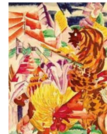
Kohouti z Bricca (1922)