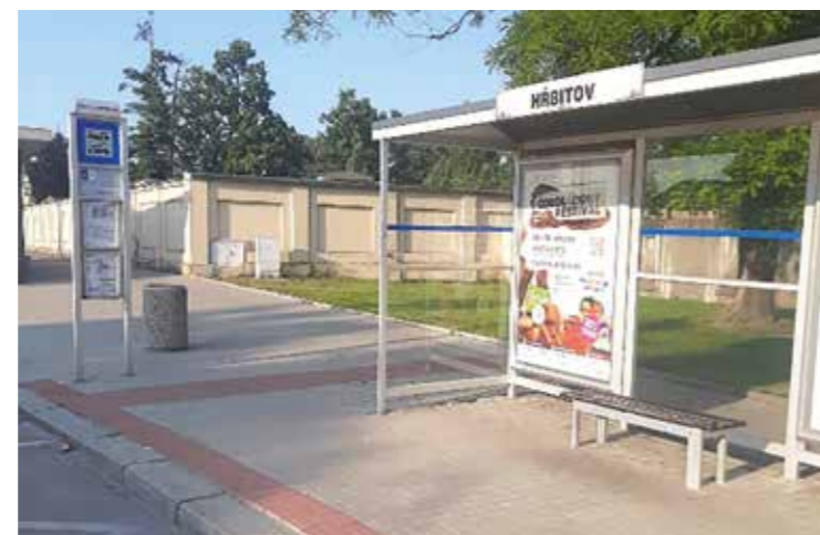
Nástupní místo Hřbitov směr DO LIBNÍČE.