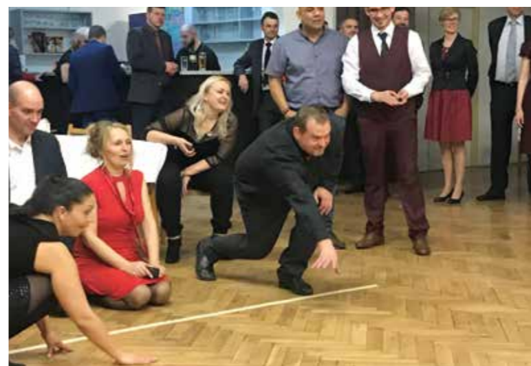
A již tradiční házení puků o Španělskou šunku