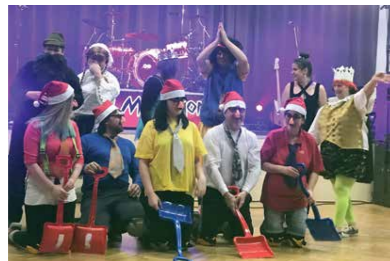
Vystoupení na Maškarním bále z Hamru