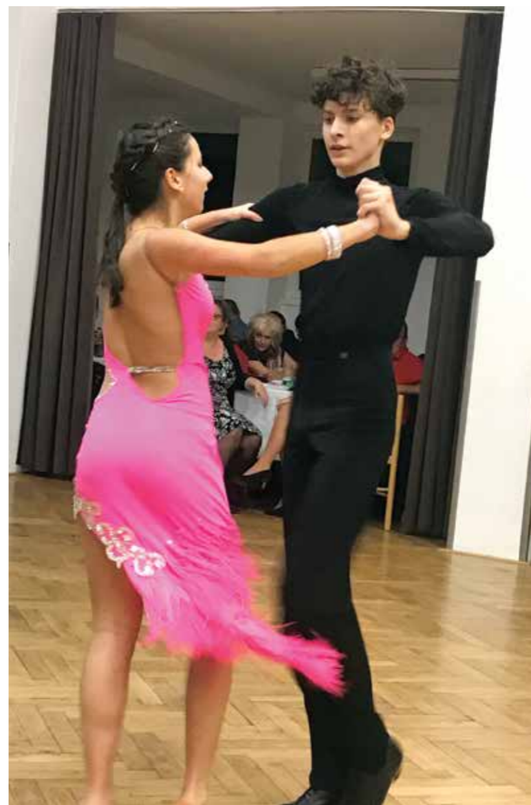
Předtančení na Obecním plese..zajistila IMA dance.