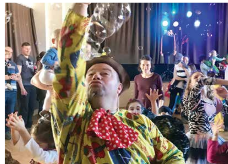
Maškarní pro děti-před obecním plesem přišlo 68 dětí