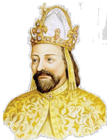
Císař Karel IV.

PŘÍSPĚVEK K „OSMIČKOVÉMU ROKU“ NAŠÍ VLASTI