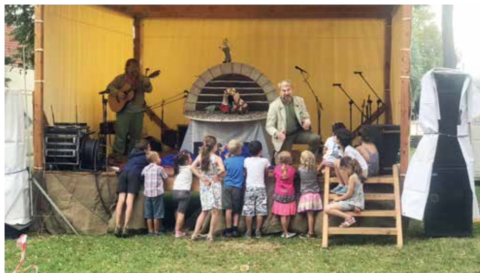
Hudebně divadelní skupina Rybníkáři