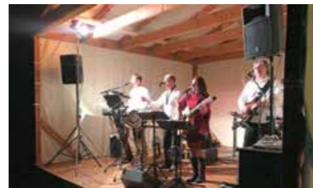
Veselice pod širým nebem s kapelou Obzor