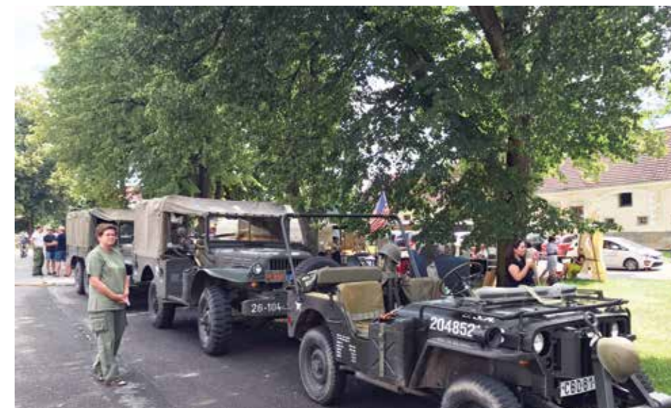
Devět vozů z muzea z Dobčické tvrže 1945 (spolek přátel vojenské historie), potěšilo malé i velké kluky.