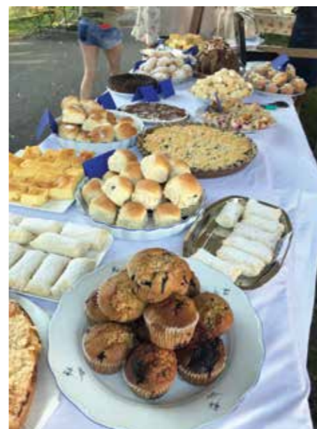
Děkujeme všem baječným pekařkám, že jako každý rok napekly do lázeňské cukrárny